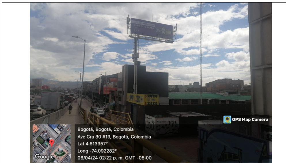
Fotografía No. 1 – Vista panorámica del predio y de la valla ubicada en la Av. Carrera 30 No. 12B – 27 (dirección catastral), orientación NORTE – SUR .